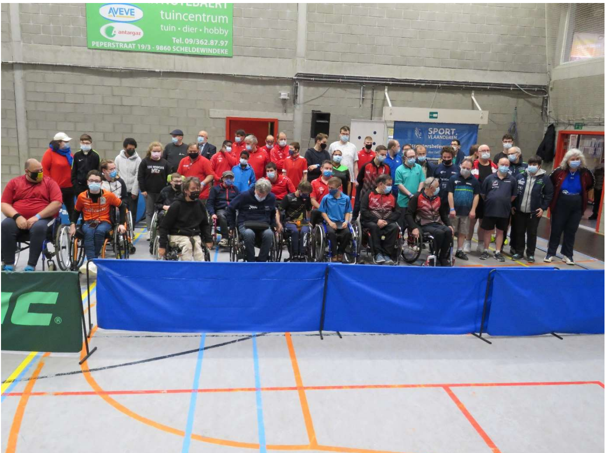
deelnemers G-tafeltennistoernooi 2021