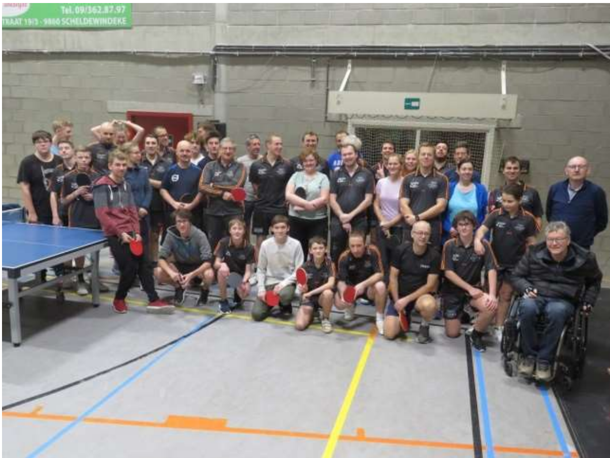
deelnemers familiedubbel toernooi 2019 (laatste editie sinds CORONA)