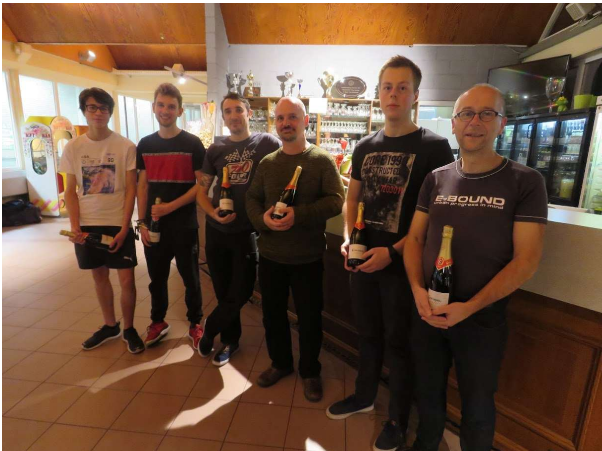
podium familiedubbel toernooi 2019 (laatste editie sinds CORONA)